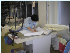
専門教科（クリーニング）