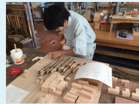
専門教科（木材加工）